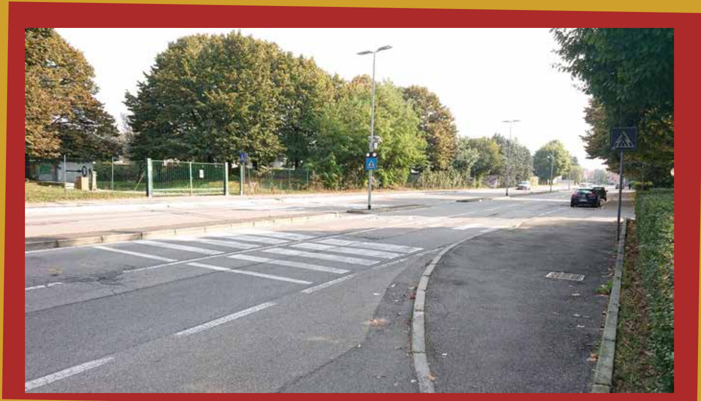
2 - In bici nei parchi