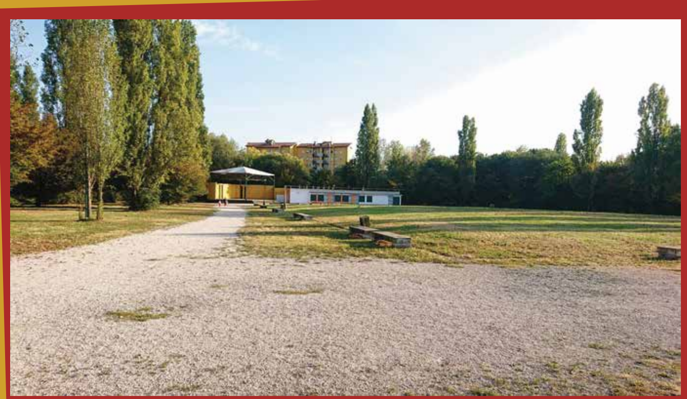
3 - Rinasce la Bressanella!