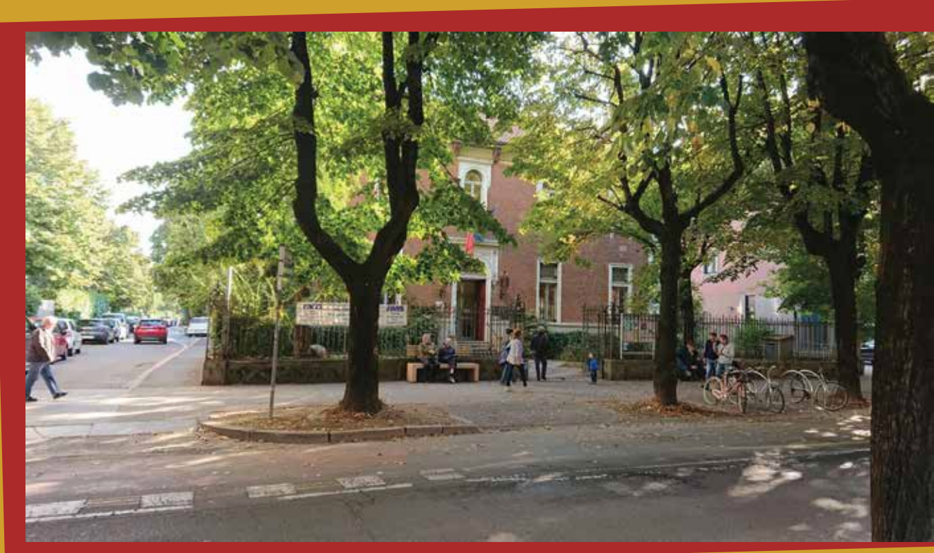
1 - La biblioteca per tutte le stagioni