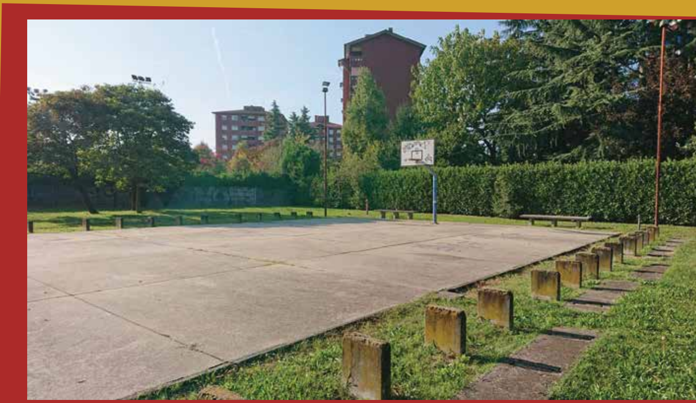
4 - Sport nei parchi per i giovani